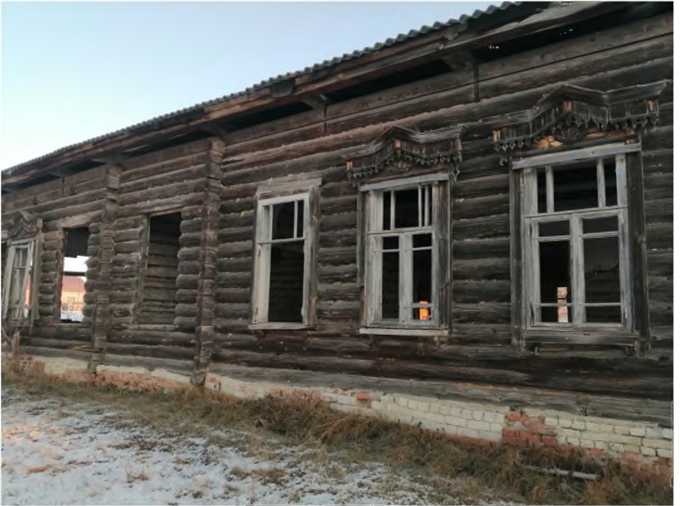
Фото 7. (декабрь 2020 г.)