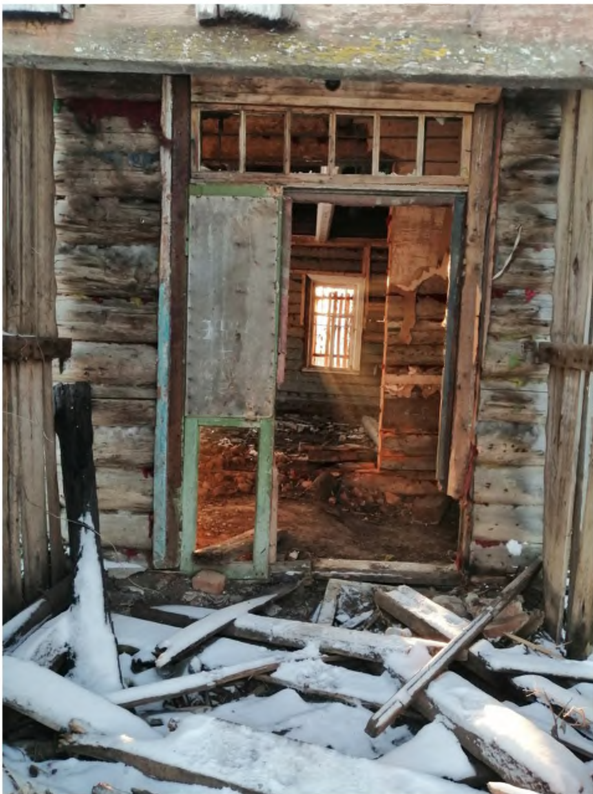
Фото 11. (декабрь 2020 г.)