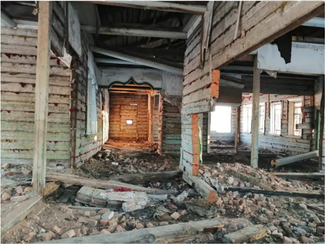
Фото 8. (декабрь 2020 г.)