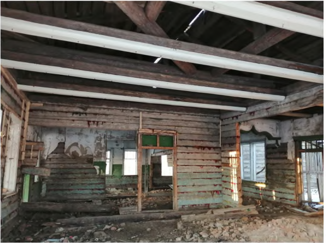
Фото 2. (декабрь 2020 г.)