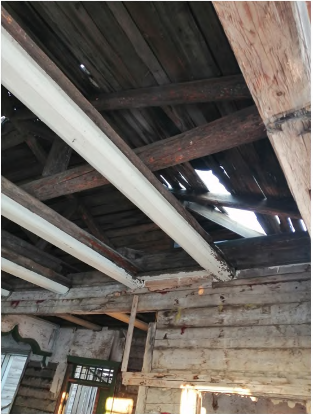
Фото 6. (декабрь 2020 г.)