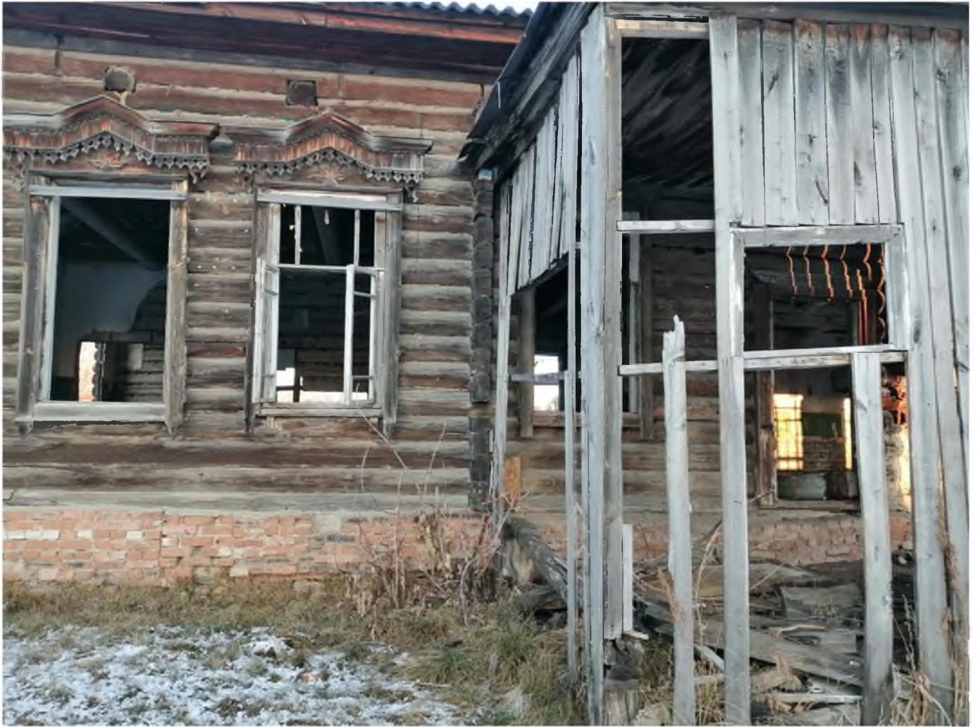
Фото 5. (декабрь 2020 г.)