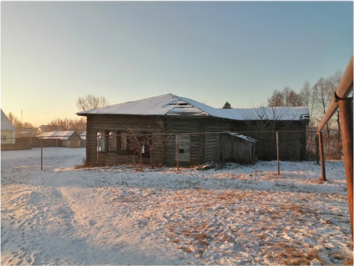
Фото 12. (декабрь 2020 г.)