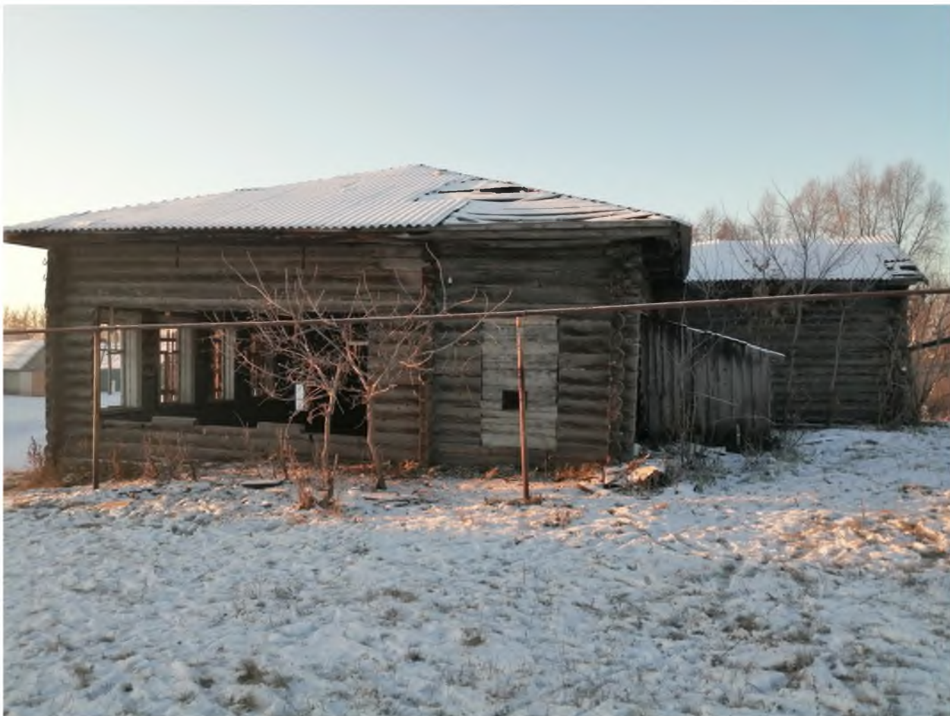
Фото 1. (декабрь 2020 г.)

Фотофиксация месторасположения объекта «Здание земской школы (перенесено из села Лесное Никольское)», нач. XX в., расположенного по адресу: Ульяновская область, Мелекесский район, с. Старая Сахча, ул. Советская, 35.