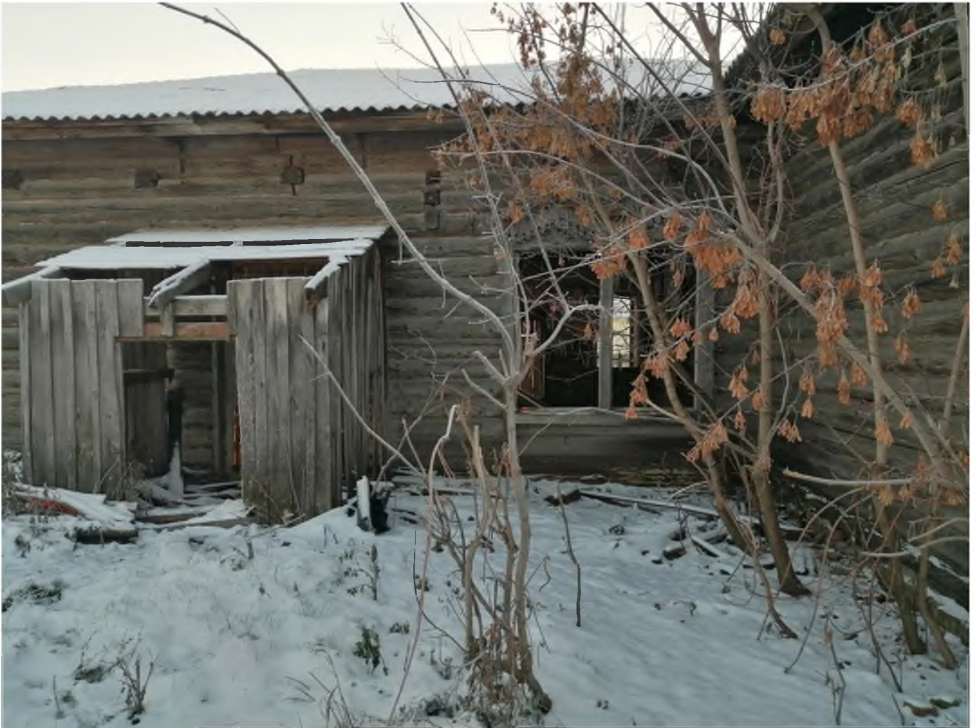
Фото 10. (декабрь 2020 г.)