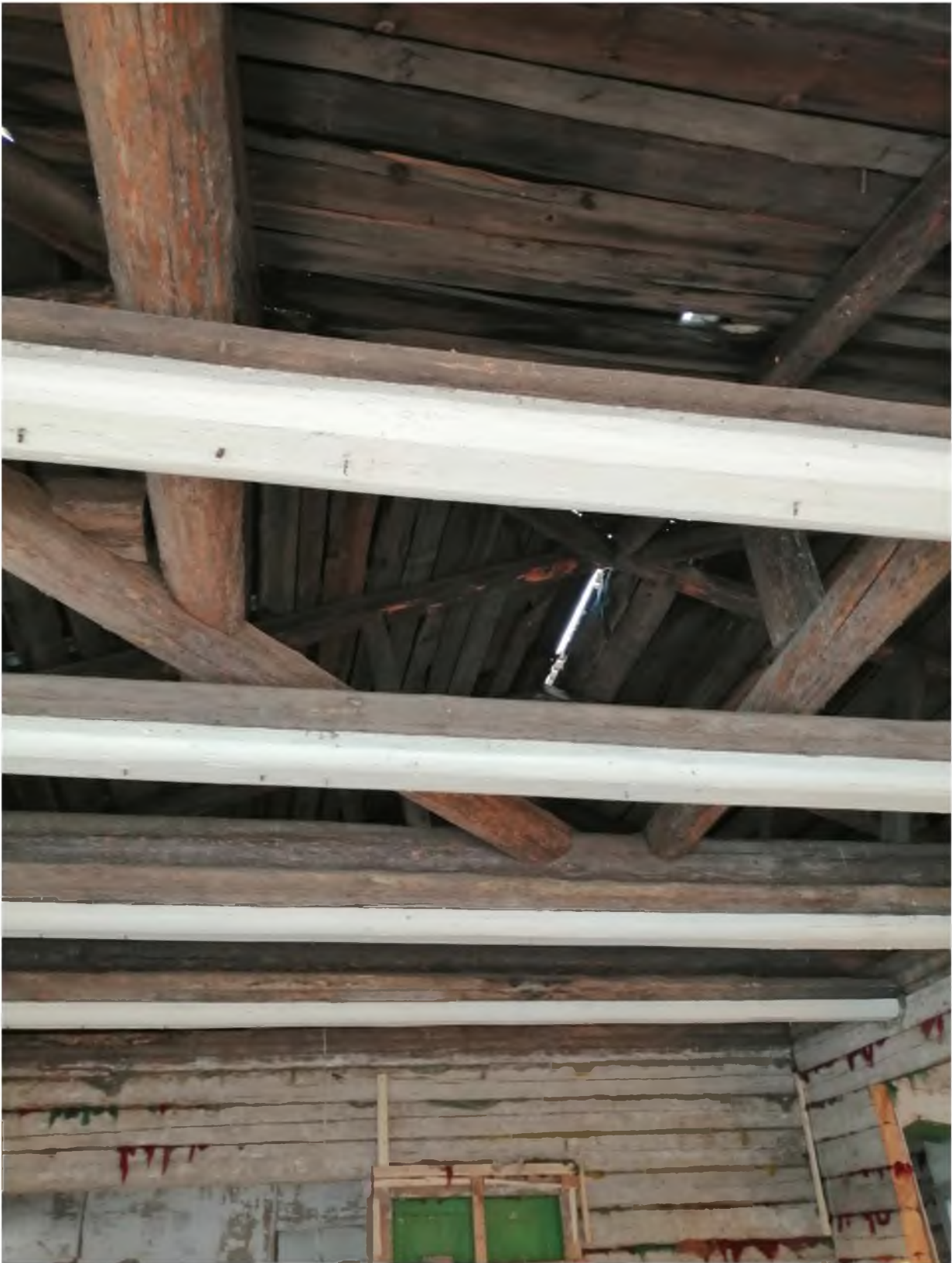
Фото 3. (декабрь 2020 г.)