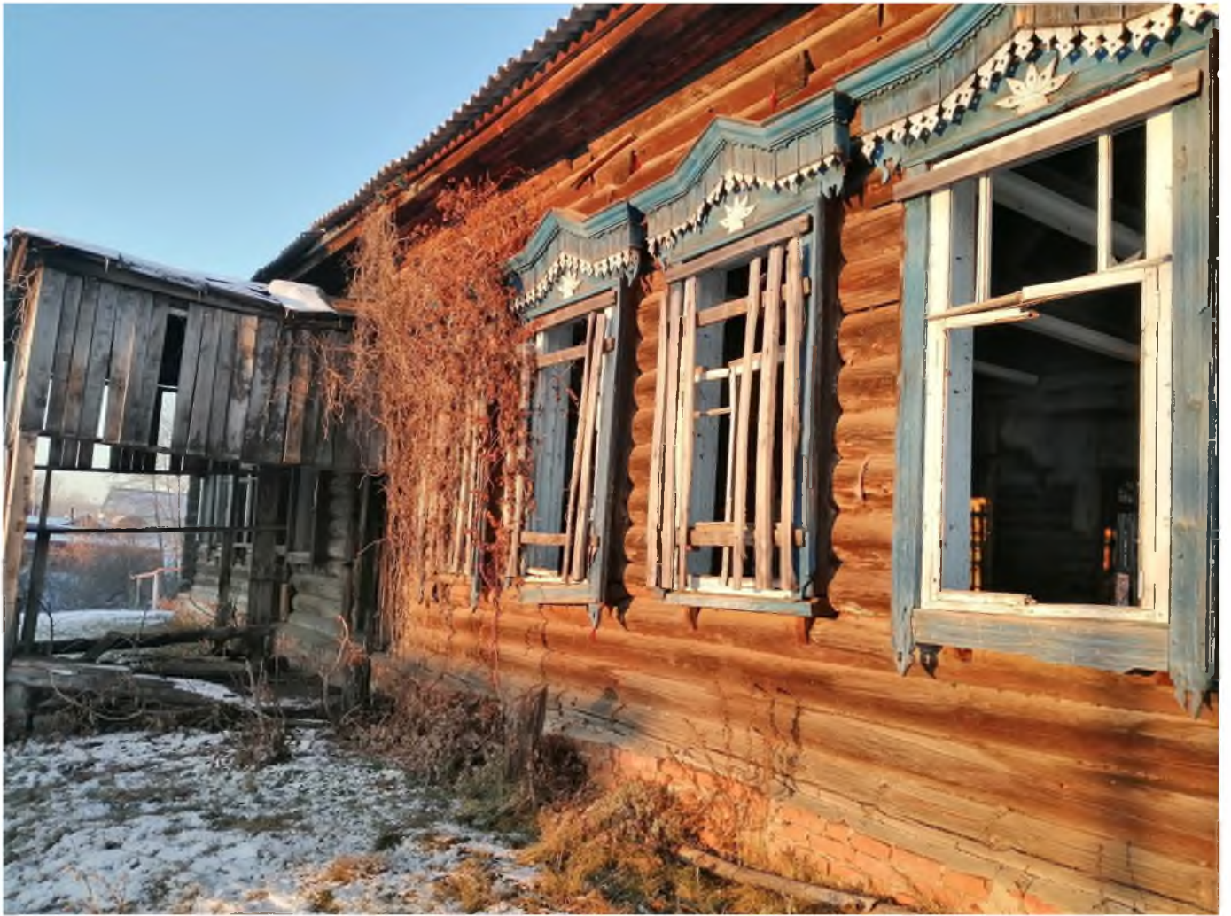
Фото 4. (декабрь 2020 г.)