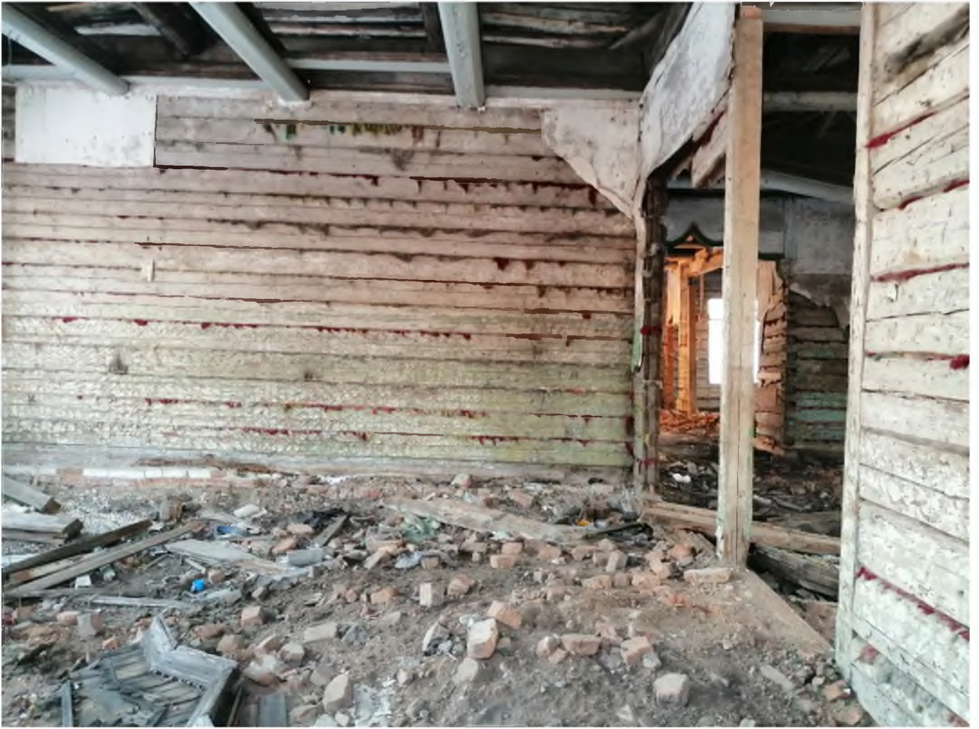
Фото 9. (декабрь 2020 г.)